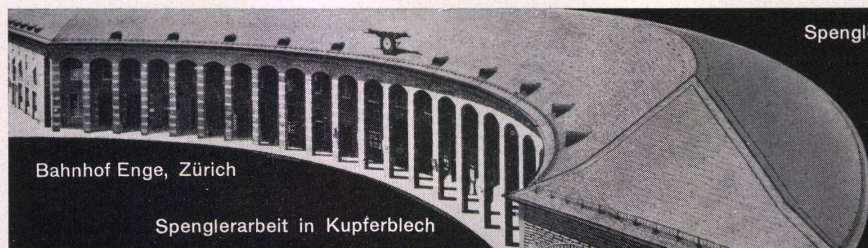
Bahnhof Enge, Zürich

die unbrennbare Platte für Akustik, Ventilation und Strahlungsheizung