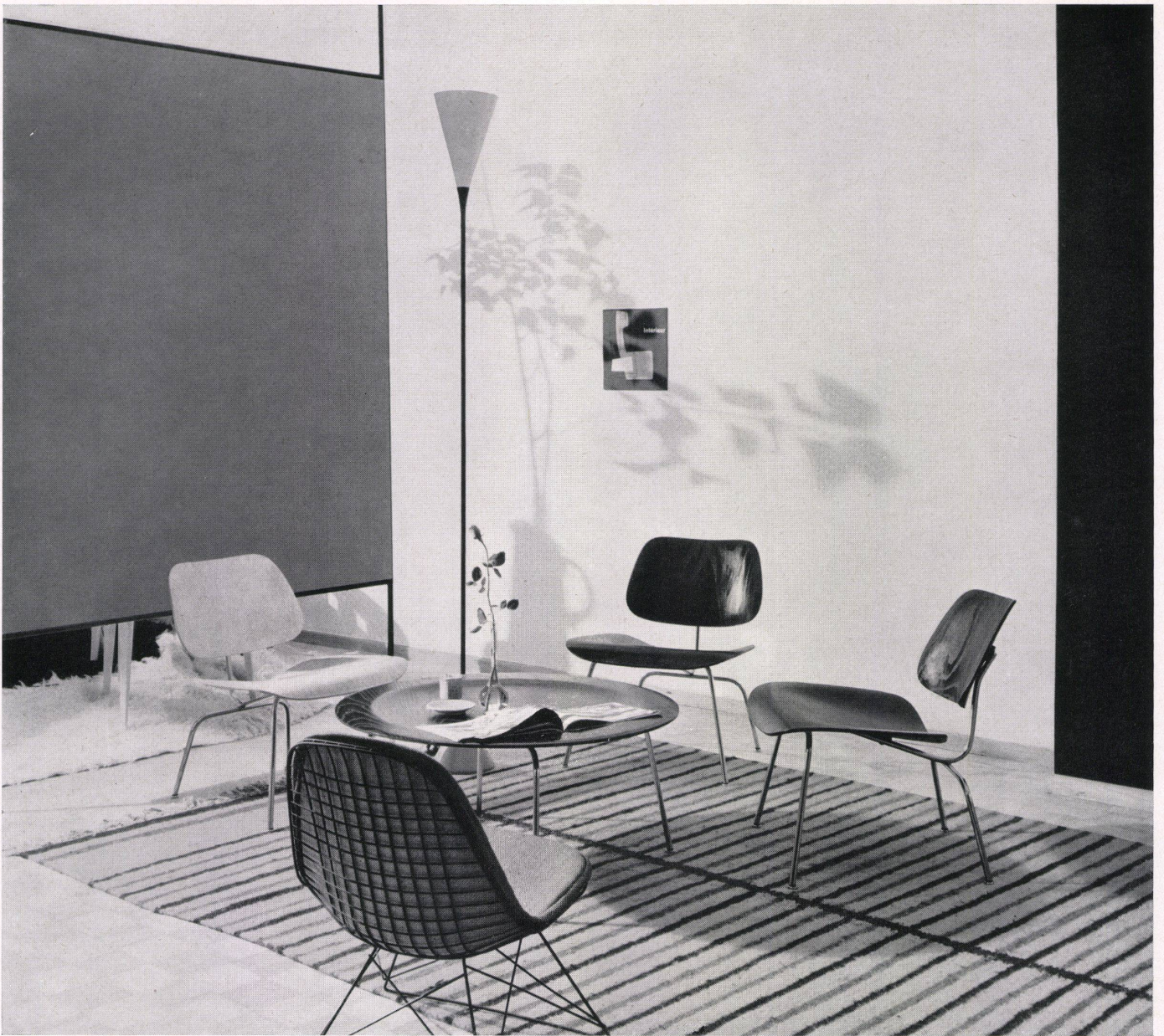
Sitzecke mit Teetisch und Stühlen von Charles Eames, Venice/Calif.

Coin de séjour avec petite table et sièges de Charles Eames, Venice/Calif.