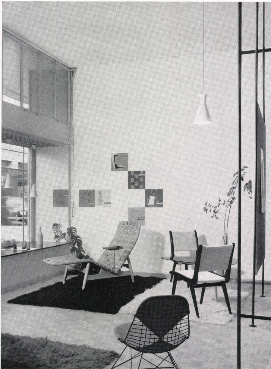
Eingangspartie mit dem Schaufenster links. Schwedische, deutsche und amerikanische Sitzmöbel. Côté entrée avec la vitrine à gauche. Sièges suédois, allemands et américains. Entrance section with the show window on the left. Swedish, German and American chairs.