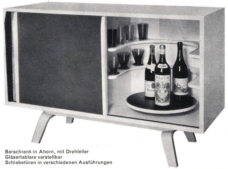
Barschrank in Ahorn, mit Drehteller Gläserntabläure verstellbar Schiebetüren in verschiedenen Ausführungen