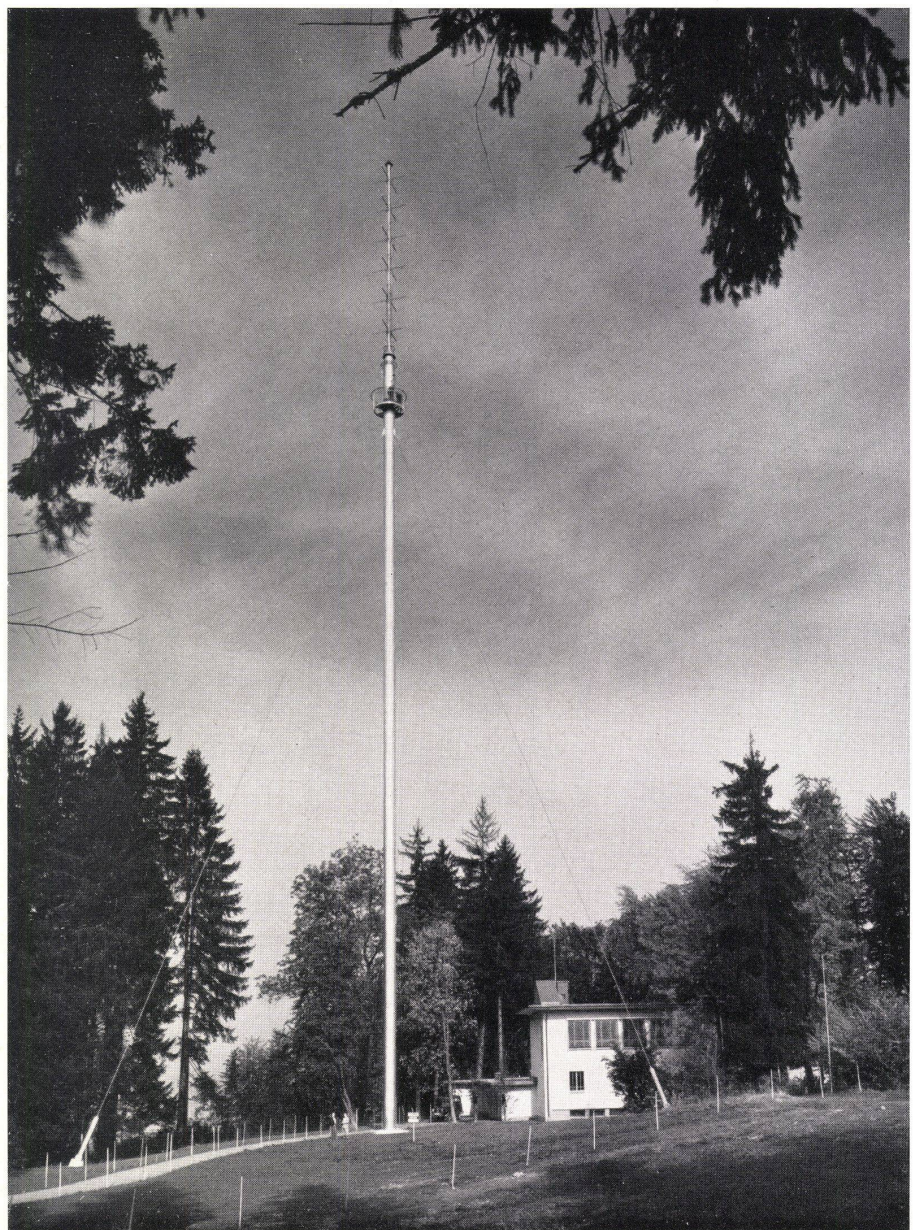
Gesamtansicht. Vue totale. Overall view.

In der Werkstätte in Pratteln wurden 10,5 m lange, fertig geschweißte Rohrabschnitte hergestellt, die dann auf die Baustelle transportiert, hochgezogen und verschraubt wurden. Bei der Einleitung der Seilkräfte in das Rohr sind (im Innern) die erforderlichen Aussteifungen angebracht. Das Äußere des Turmes wurde spritzverzinkt und mit einem porenfüllenden Anstrich versehen. Das Innere, das für Unterhaltsarbeiten leicht zugänglich ist, wurde ein-