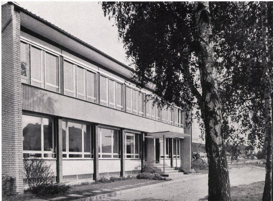
Verwaltungsgebäude der Papiersackfabrik Rothrist, O. Glaus, Arch. BSA.

AG. DER MASCHINENFABRIK VON THEODOR BELL & CIE. KRIENS-LUZERN TELEFON 041 / 2 03 16