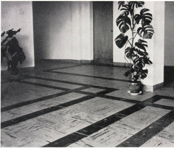
Kentile-Platten in einer Eingangshalle