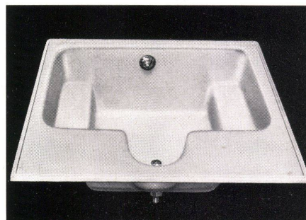
Detail der «Poliban»-Wanne