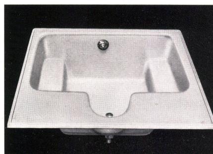
Detail der «Poliban»-Wanne