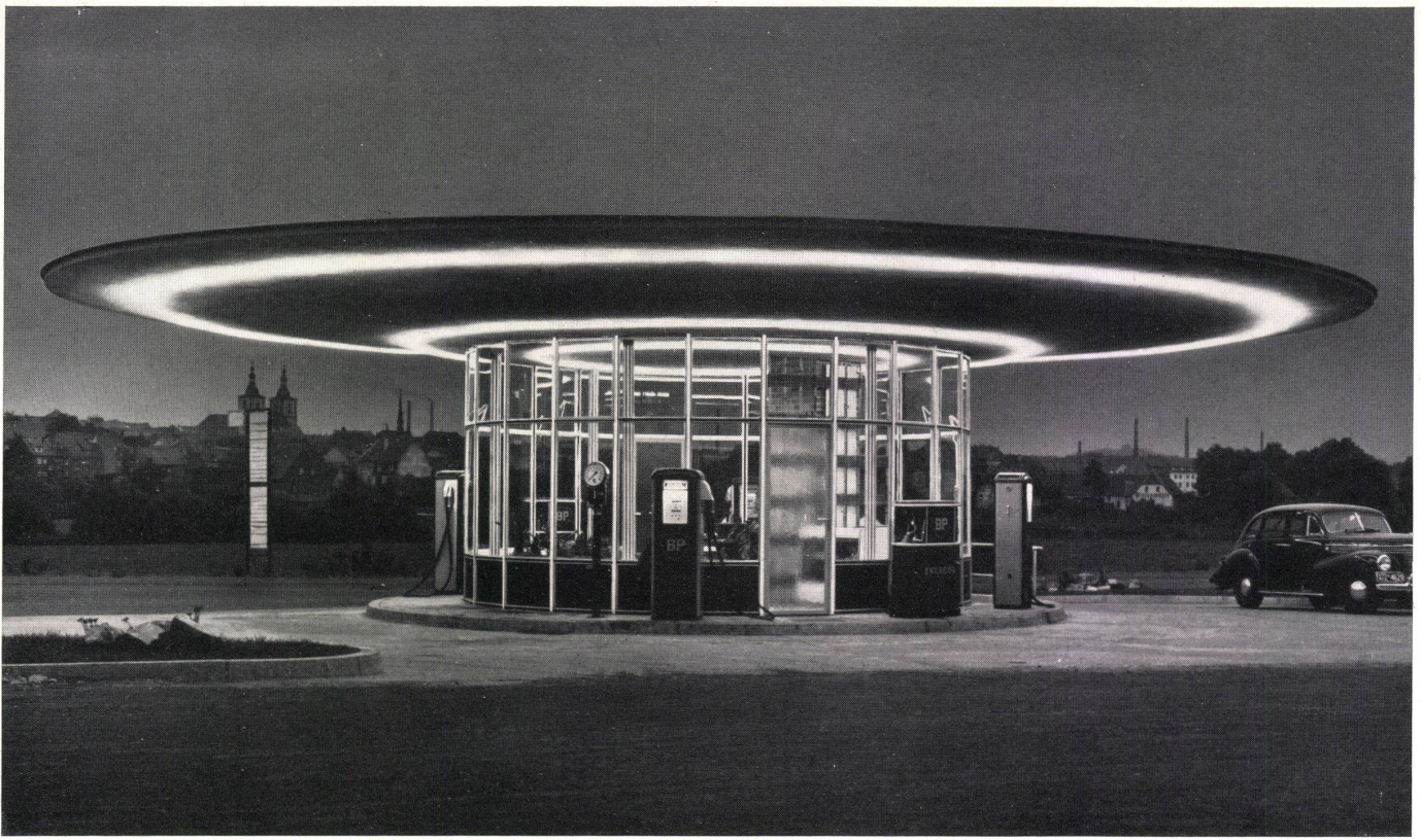
Gesamtansicht in der Dämmerung. Vue d'ensemble au crépuscule. General view at dawn.