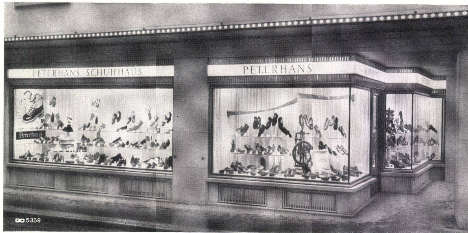
Geilinger & Co. Winterthur