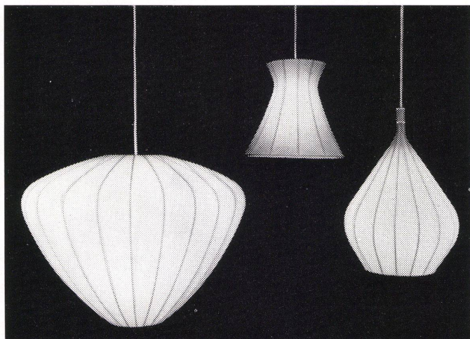
Chrysalin-Lampen Fr. 41.50 - 74.50 Klingele, Basel, Aeschen 34