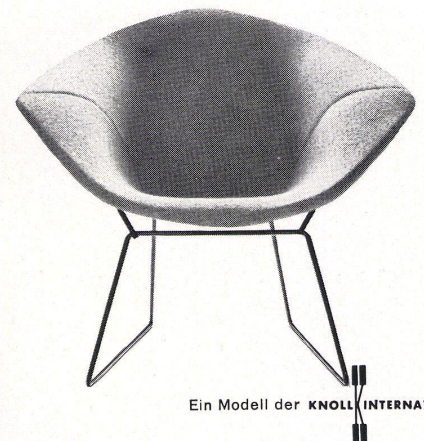
Ein Modell der KNOLL INTERNATIONAL