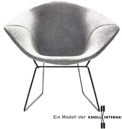
Ein Modell der KNOLL INTERNATIONAL

bauliche Entwicklung in Zürich läßt diese vernünftigen Basler Grundlagen und Erfahrungen in einem äußerst aktuellen Licht erscheinen. Wir werden anläßlich einer geplanten Städtenummer ausführlich über diesen Vortrag referieren. Zie.