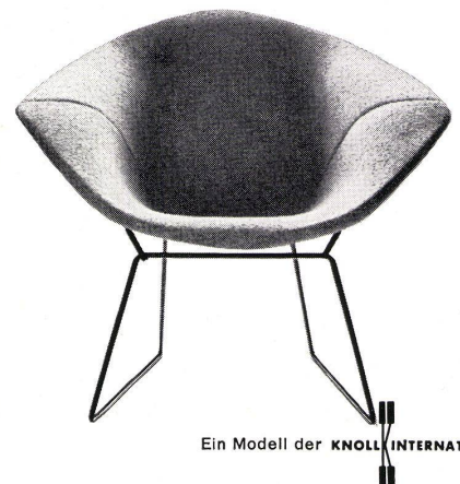
Ein Modell der KNOLL INTERNATIONAL