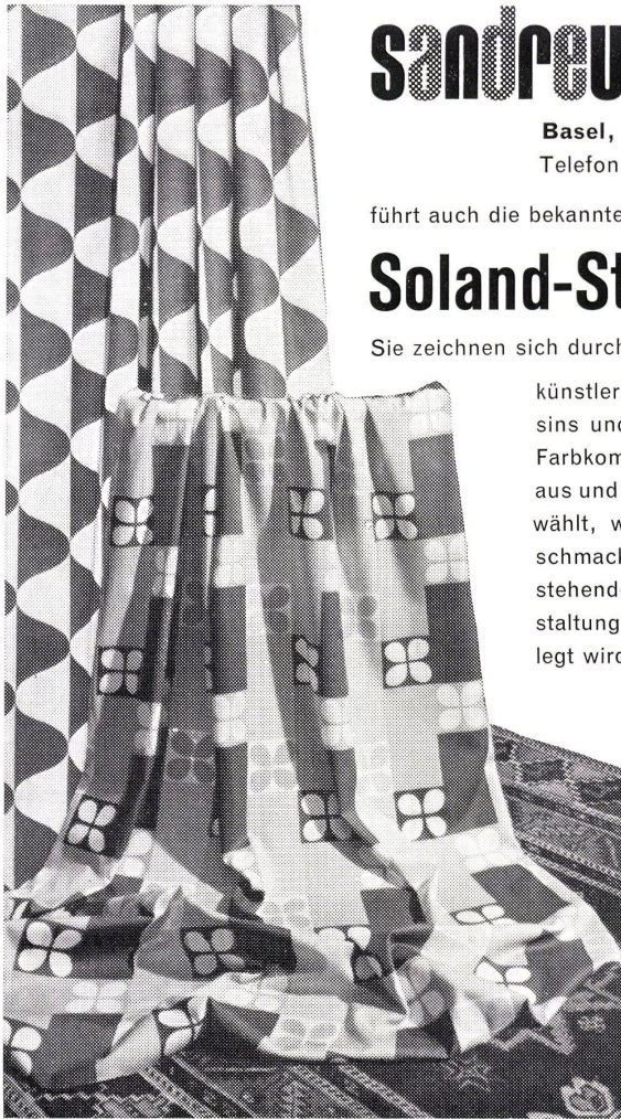
Dessin «ONDA» Dessin «TREFLE»

künstlerische Designs und schönste Farbkombinationen aus und werden gewählt, wo auf geschmacklich hochstehende Raumgestaltung Wert gelegt wird.