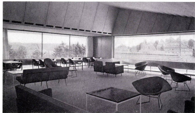
Abbildung unten Gäste-Einer-Zimmer

Abbildung oben Empfangshalle im Dachstock