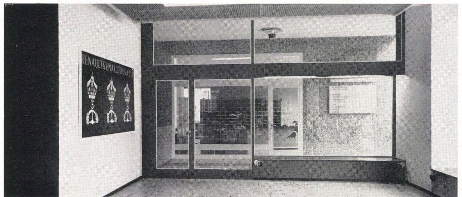
3 Haupteingang vom Platz aus. L'entrée principale de la place. The main entrance from the square.