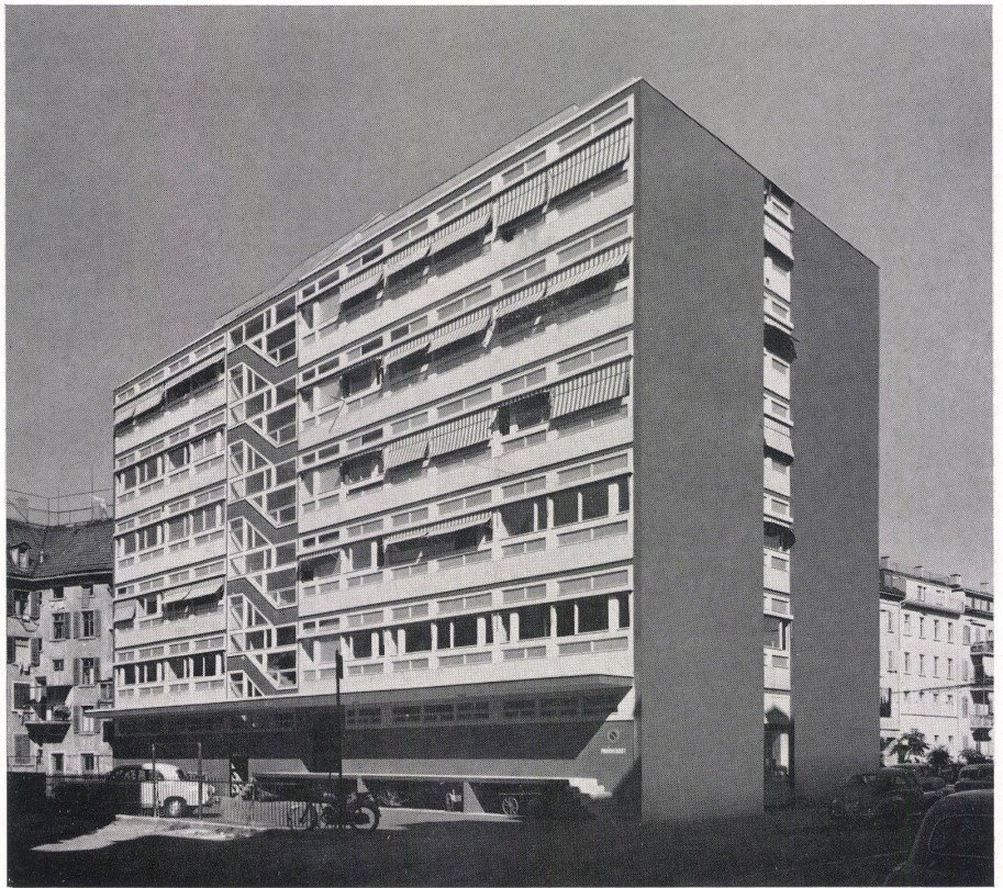
1 Ansicht des Geschäftshauses von Südwest mit Blick auf die mit Fensterelementen verkleidete Südfassade und die als Windscheibe wirkende Westfassade. Vue du bâtiment commercial du sud-ouest, sur la façade sud revêtue d'éléments de fenêtres et sur la façade ouest faisant quasiment fonction de pare-brise. Southwest view of the business building showing the glazed south façade and west façade acting as sort of a wind screen.