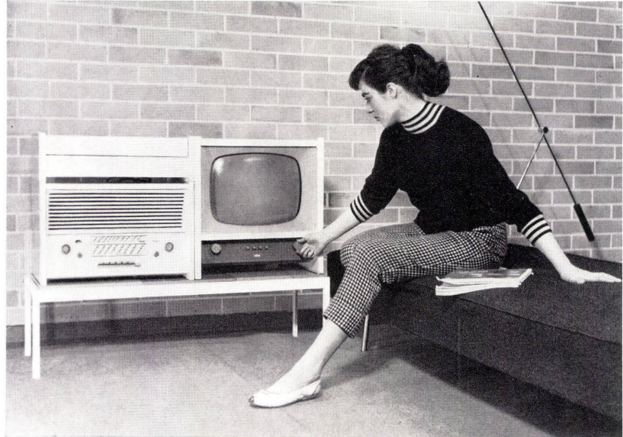
Entwurf: Hochschule für Gestaltung in Ulm

Die Aufnahme zeigt einen BRAUN-FSG-Fernsehapparat, ein G 11-Radiogerät und einen Plattenspieler G 12, alle in Ahorn weiß. Auf diese Weise lassen sich die Geräte kombinieren. Das Baukastensystem der Anbaumöbel ist damit zum erstenmal auch für Radio-, Fernseh- und Phonogeräte verwendet worden.