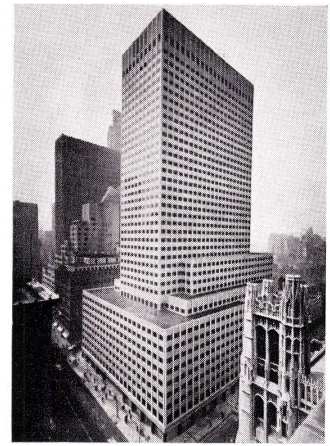
Eines der modernsten Bürohochhäuser, gebaut von Tishman

Das Stahlgerüst der 666 Fifth Avenue ist durchwegs verbolzt (all-bolting), nicht vernietet (riveted). Je zwei Mann bilden zusammen ein «bolting-team». Sie kön-