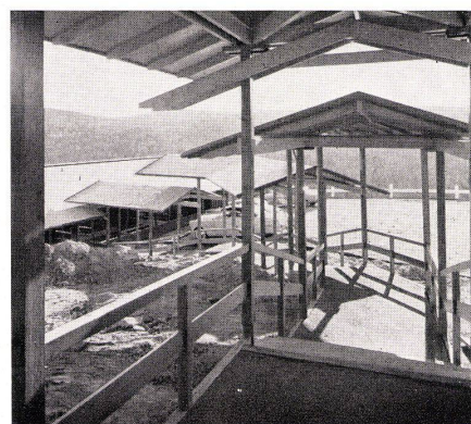
6 Zimmerinnenansicht. Vue d'une chambre. Room interior.