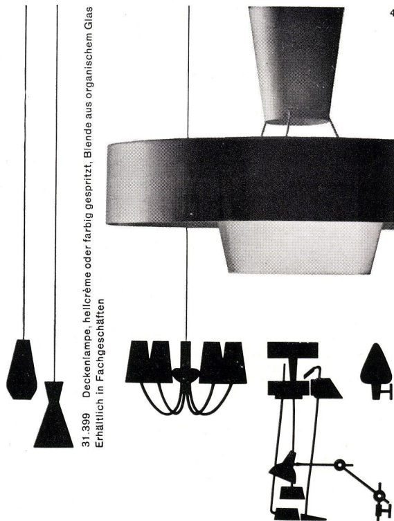
31.399 Deckenlampe, hellicrème oder farbig gespritzt. Blende aus organischem Glas. Erhältlich in Fachgeschäften