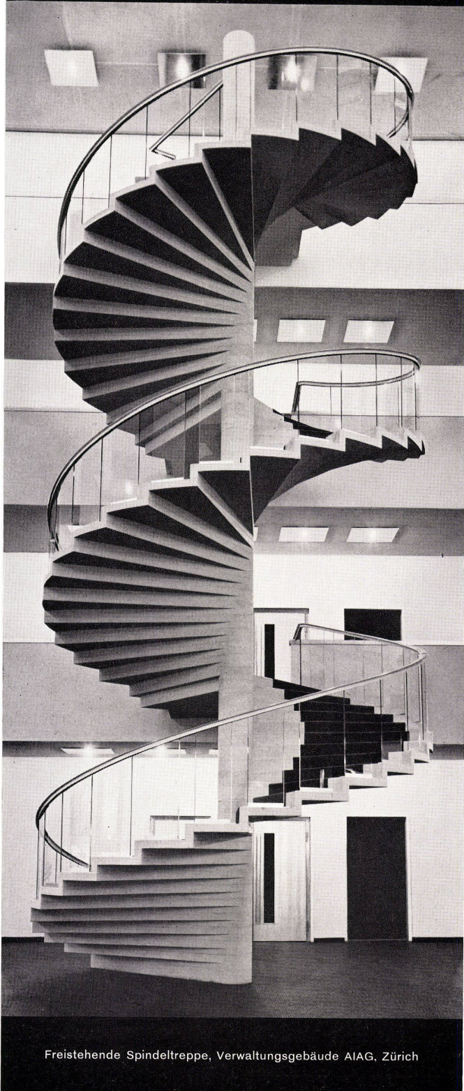
Freistehende Spindeltreppe, Verwaltungsgebäude AIAG, Zürich

Ausführung sämtlicher Kunststeinarbeiten