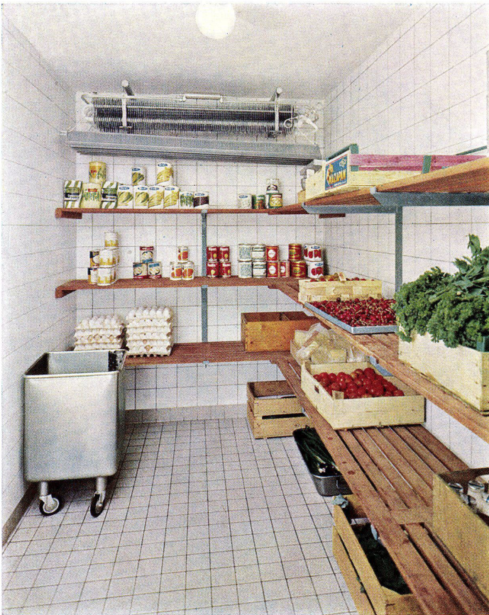
Kühlraum im Klubhaus der Schweizerischen Rückversicherungs-Gesellschaft

werden nicht nur der dekorativen Gestaltungsmöglichkeiten und der reichen Farbauswahl wegen bevorzugt, sondern sie finden überall dort Verwendung, wo höchste Anforderungen gestellt werden an: