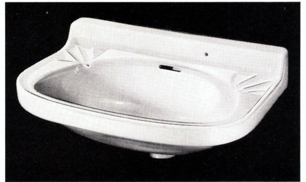
Wandbecken «STAR» Nr. 7325, 49 x 32 cm

tischgruppe entwurf hans eichenberger platte in drei verschiedenen grössen ganz mit «textolite» verkleidet nussbaum oder eiche furniert säulenfuss stahlrohr verchromt stuhl stahlrohr verchromt rück- und armlehne mit naturjunc umwickelt polster mit schwarzem «boltaflex»-bezug prospekt auf anfrage