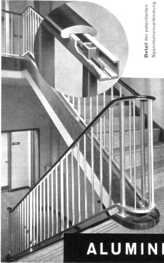
Detail der patentierten Spannbolzenverbindung