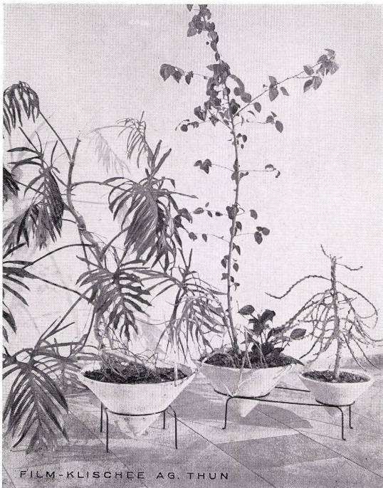
FILM-KLISCHEE AG. THUN