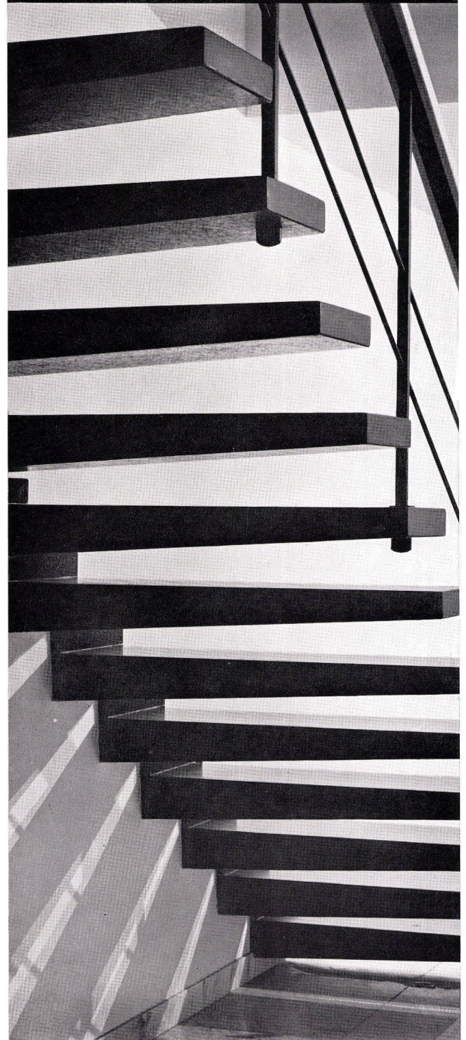
Einseitig eingespannte auskragende Trittplatten in Basler Privathaus Burckhardt Architekten BSA SIA, Base!