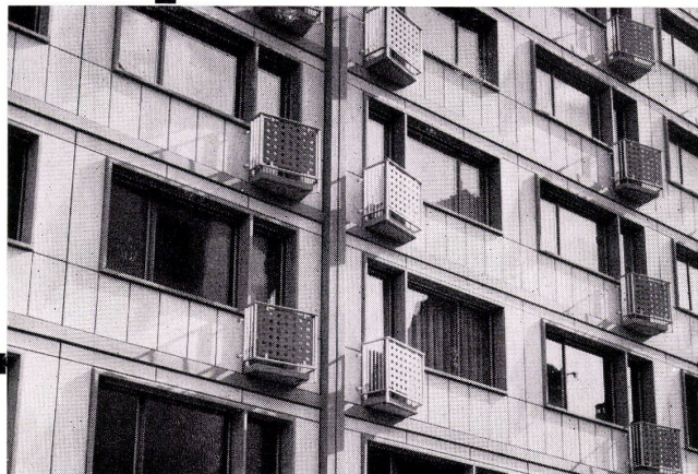
Fassaden-Fertigelemente, Stärke 18 cm, k = 0.70 \text{ kcal/m}^2\text{h}^\circ\text{C} , Gewicht nur 145 \text{ kg/m}^2 Entwurf: W. & M. Ribary, Arch., Luzern