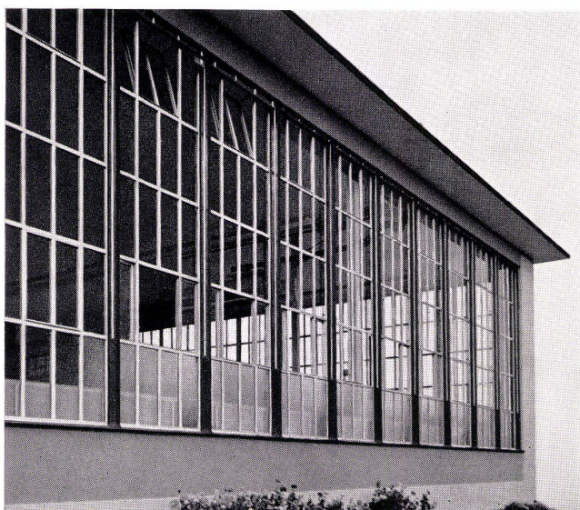
ALSEC-Leichtmetallprofile K = 2,25 - 2,5 Isolierglas-Elemente K = 2,5 - 3,0