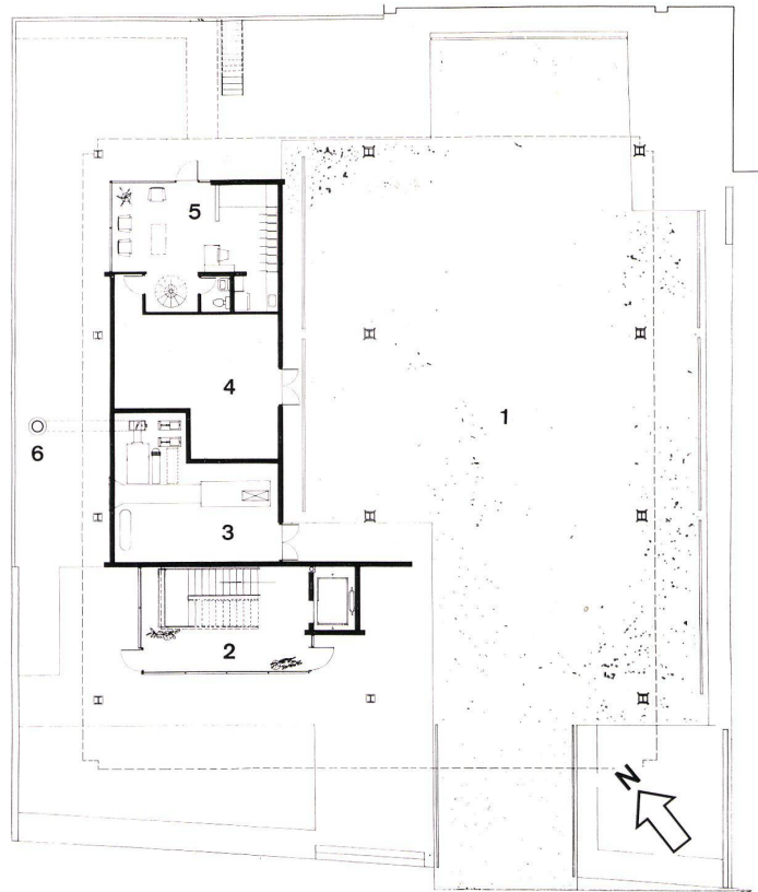
1 Erdgeschoßgrundriß 1 : 300. Plan du rez-de-chaussée.

Jedes Haus besteht aus gleichen Elementen, und doch sieht ein jedes anders aus und paßt