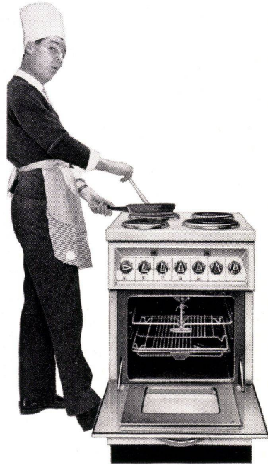
Dr. M. Heuberger Reklameberater / Gestaltung H. Buholzer

mit dem PROMETHEUS-BEL-DOOR-Herd hat sich schon mancher Mann als Koch entdeckt. Hell begeistert sind alle vom grossen Backofen mit Innenbeleuchtung und den zuverlässigen Leuchtschaltern. Weitere BEL-DOOR-Rosinen: Beheizbare Geräteschublade, aushängbare Backofentüre mit Schauglas, schräges Schalterpult, Thermostat, Infrarotgrill sowie Grillspieß mit Motor.