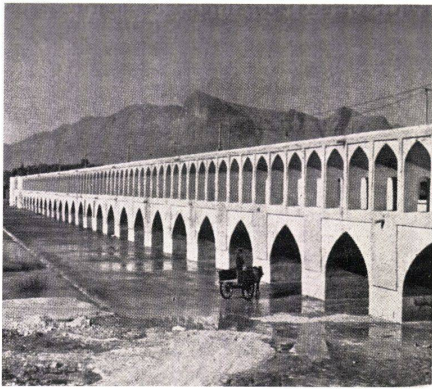
2 Brücke des Allahverdi Khan in Isfahan, gebaut um 1600. Pont de Allahverdi Khan à Isfahan, construit en 1600. Bridge of Allahverdi Khan in Isfahan, built in 1600.

3 Minoru Yamasaki, Universitätsgebäude in Detroit. Yamasaki schreibt 1957 im »Journal of Architectural Education« Nr. 2: »Die Architekturgeschichte, die während der letzten zwei Jahrzehnte als Teil der Aufgabe, Architektur zu lernen und auszuführen, ignoriert wurde, hat heute ihren Platz in der Architekturerziehung wieder eingenommen. Ein Beweis dafür, daß unsere zeitgenössische Architektur reifer wird, ist der Verlust der Selbstsicherheit gegenüber der Geschichte.