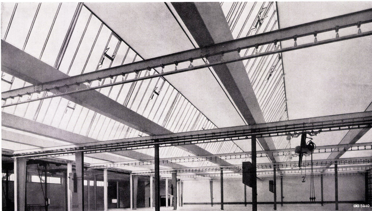
Geilinger & Co. Winterthur

gute Lichtverhältnisse hohe Wirtschaftlichkeit kurze Bauzeit