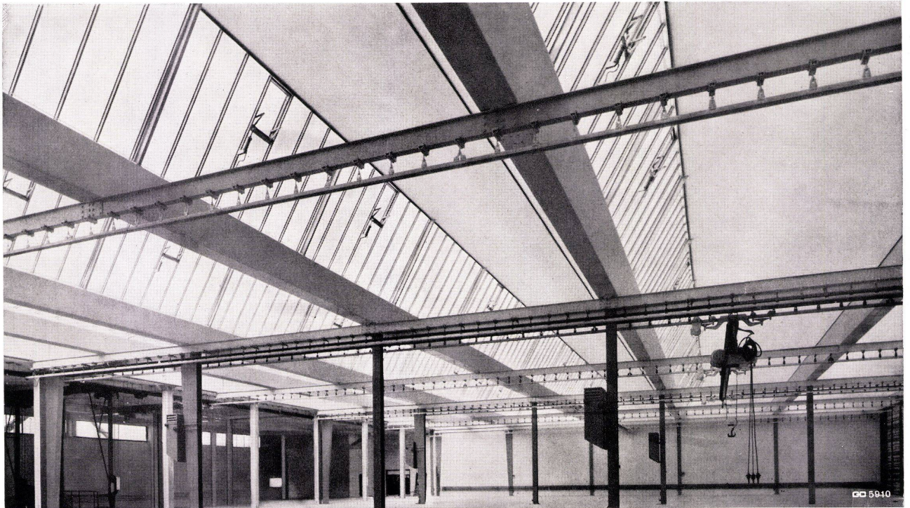
Geilinger & Co. Winterthur

gute Lichtverhältnisse hohe Wirtschaftlichkeit kurze Bauzeit