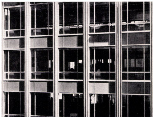
Leichtmetall-Fenster und Fassadenbau