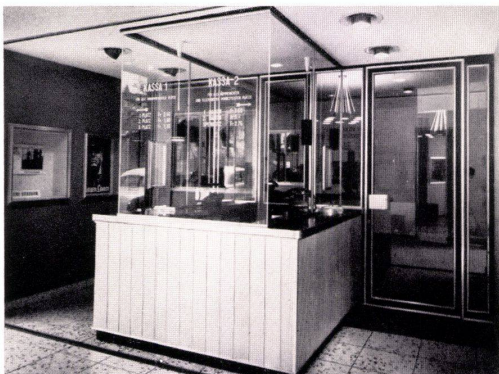
Schaufenster-Anlagen Türen — Portale

Modernes GLISSA-Bauprofil-Programm Konstruktionen für höchste Ansprüche