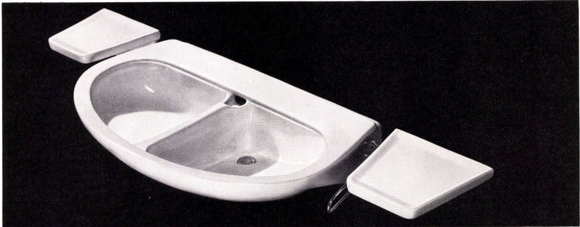
Doppelwaschtisch Sabez 5600, Grösse 90 x 58 cm, mit Abstell- tablar No. 8740, links, rechts oder beidseitig montierbar. Patent und intern. Musterschutz angemeldet. Sanitär-Bedarf AG., Sanitäre Apparate und Armaturen Zürich 8/32, Kreuzstrasse 54, Telefon 051/24 67 33