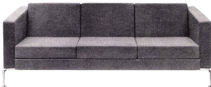
Sofa Mod. wh 200 206 cm lang ab Fr. 1220.- 266 cm lang ab Fr. 1500.-

Die sogenannte Kunststoffplatte hat sich in der Praxis seit Jahren bewährt. Ihre spiegelglatte, stoß- und