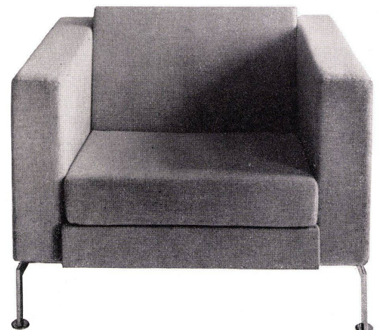
Fauteuil Mod. wh 200 mit Stoffbezug ab Fr. 600.- in Leder ab Fr. 1060.- Ausführung mit Daunen-, Schaumgummi- oder Federkern-Polsterung.