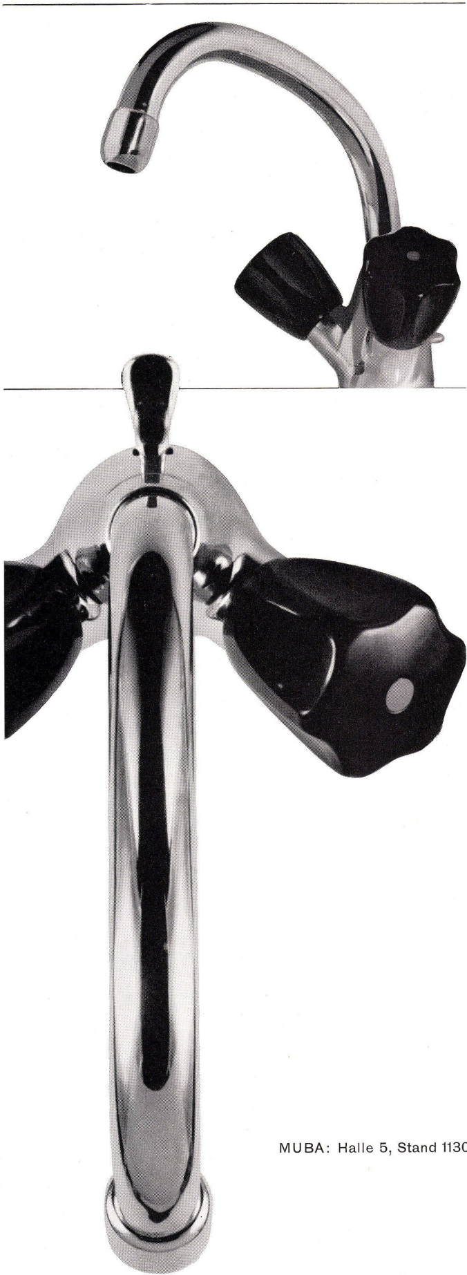
MUBA: Halle 5, Stand 1130

Einloch-Waschtischbatterie Nr. 3072 mit schwenkbarem Auslauf und Ablaufventil