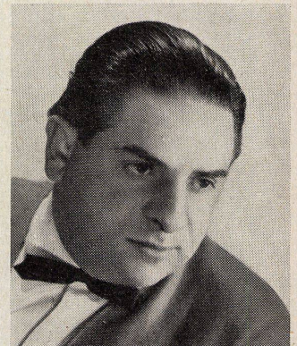
◀ Charles Eames

Auszeichnung für einen Möbelentwurf »Die gute Form 1958«