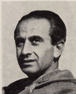
Aris Konstantinidis ▲

Palast des Kronprinzen von Japan in Tokio, Entworfen 1958, gebaut 1960