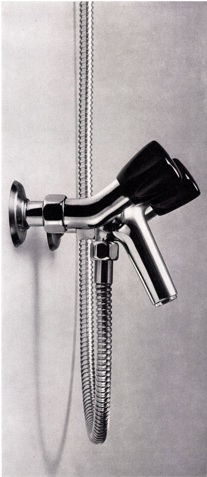
Badebatterie 1724, 1/2" Anschlußdistanz 153 mm

Diese modern gestaltete Batterie weist folgende Vorzüge auf: Wegfall des Steigbogens – einfacher, schöner Abgang des Brauseschlauches Zugventil für die Umstellung von Auslauf auf Brause anstelle des oft verkalkten Reibers Verwendung bester Materialien