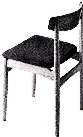
Mod. 760 P