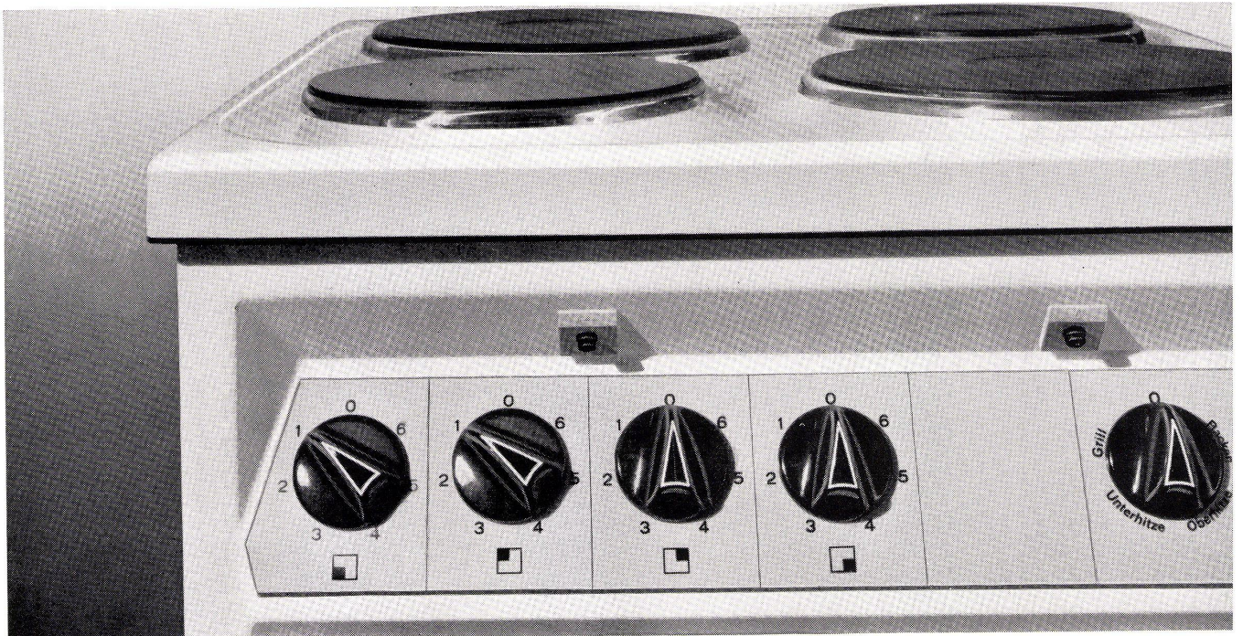
Dr. Heuberger + Frey, Foto Löhndorf, Grafik Edi Hauri

PROMETHEUS AG Liestal/BL Telephon 061-84 44 71