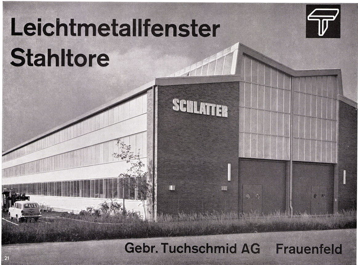
Gebr. Tuchs Schmid AG Frauenfeld