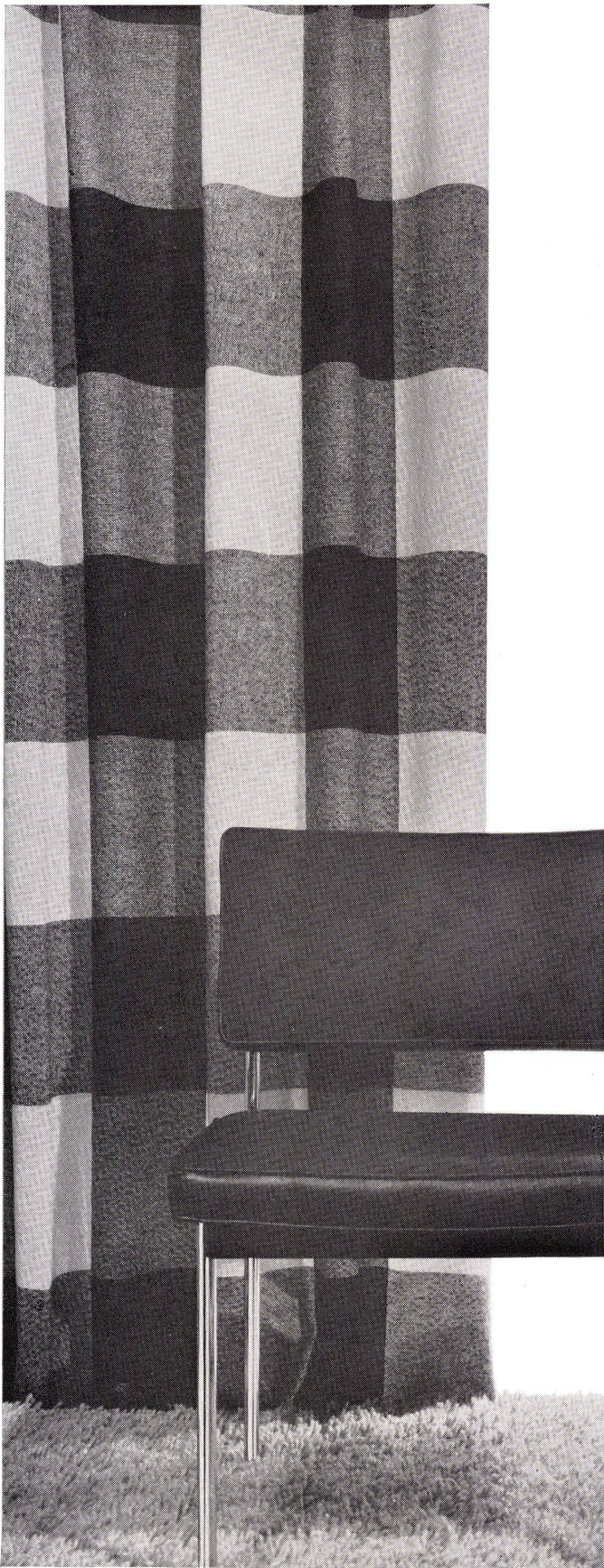
der neue Vorhang aus der internationalen Auswahl exklusiver Stoffe