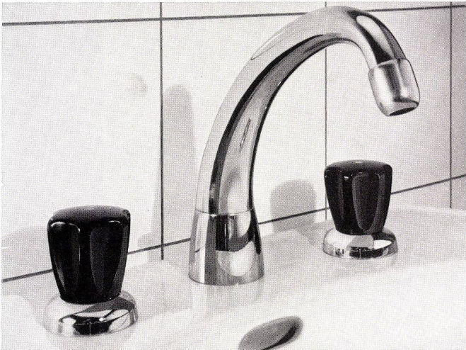
Waschtischbatterie Nr. 3076

Eingedenk der Tatsache, daß die formschöne Armatur ein wesentliches Element moderner Wohnkultur darstellt, hat KWC eine Reihe neuer Waschtischarmaturen entwickelt, die dank ihrer zeitlosen Eleganz und ihrem qualitativen Niveau Spitzenprodukte repräsentieren. Modernes Formempfinden und traditionelles Streben nach überragender Qualität waren die Leitmotive bei der Entwicklung dieser neuen Armaturentypen.