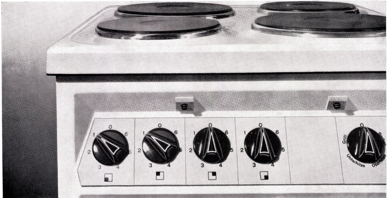
Dr. Heuberger + Frey, Foto Löhndorf, Grafik Edi Hauri

PROMETHEUS AG Liestal/BL Telephon 061-84 44 71