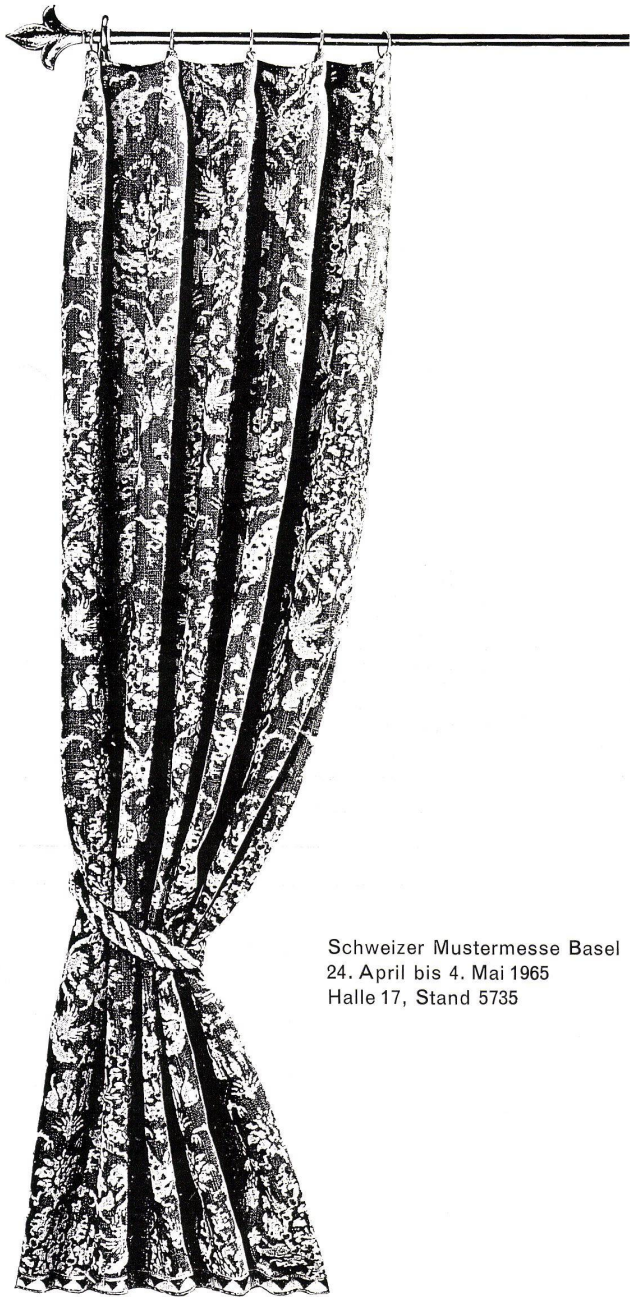
Schweizer Mustermesse Basel 24. April bis 4. Mai 1965 Halle 17, Stand 5735

Eine der reichsten Kollektionen von Vorhangstoffen finden Sie bei K+K. Mit Geschmack und Geschick werden Vorhänge , Wandbespannung und Spannteppiche auf den Raum und die Möbel abgestimmt. K+K verwirklichen Ihre Wünsche mit handwerklicher Sorgfalt!