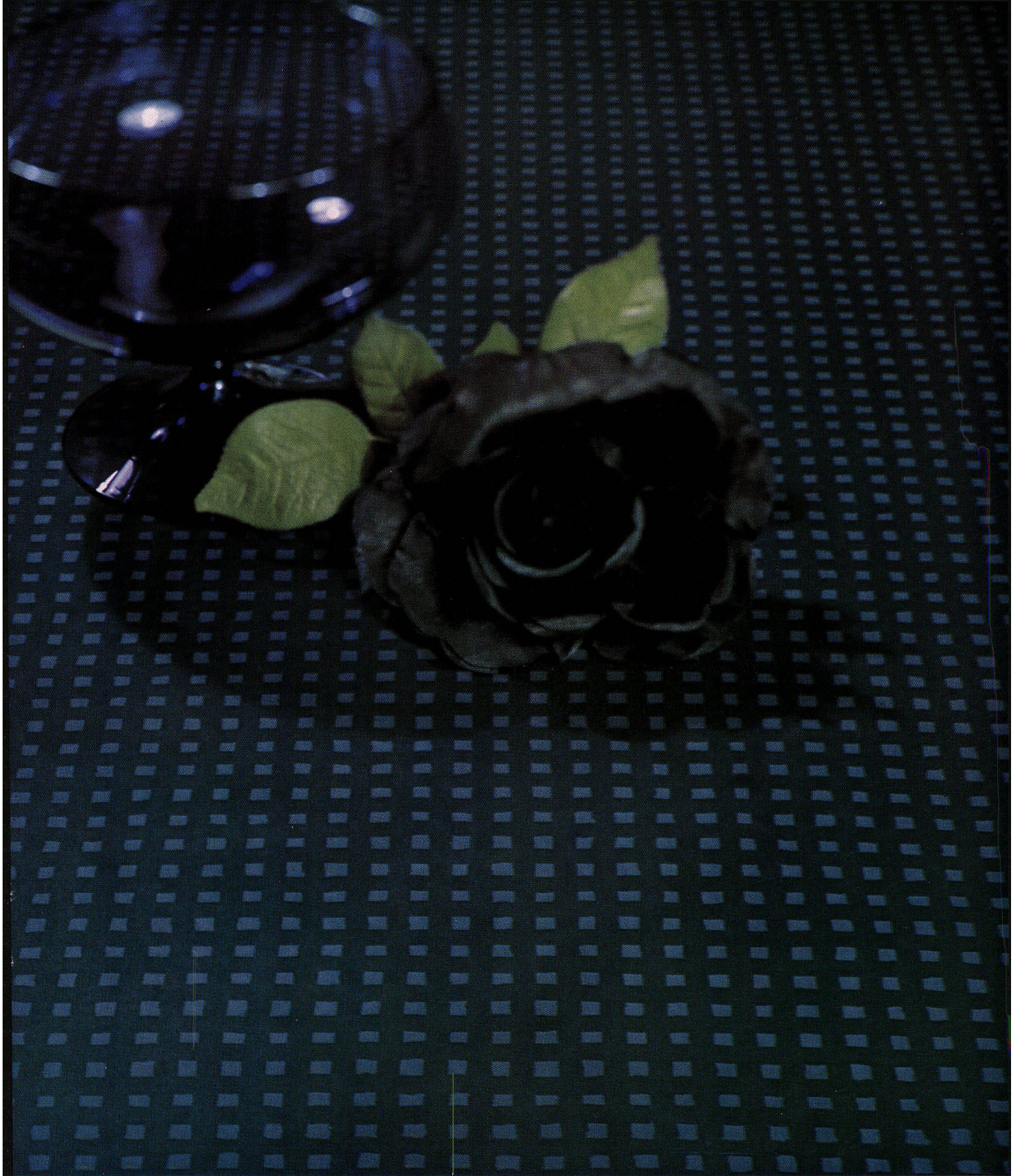
Dessin Nr. 2046 aus der Polo-Farbserie der RESOPAL-Schichtpreßstoffplatten

... zweckmäßig und schön, ein Material unserer Zeit