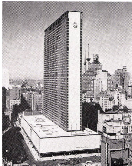
1 Hilton, New York, von William Tabler.

Nun gibt es Stimmen, welche die für ein Großstadthotel als angemessen beschriebene Atmosphäre nicht als zeitgemäß anerkennen und die soziale Funktion des Hotels in unserer Gesellschaft anders definieren. Sie sehen in einem solchen Hotel vor allem eine praktische Einrichtung, deren Hauptfunktion es ist, die physischen Ansprüche des Reisenden zu befriedigen: ihm schnell ein bequemes Bett in einem ruhigen Zimmer oder ein gutes Essen in einem reibungslos funktionierenden Restaurant zu bieten, hygienische Sauberkeit und die letzten Errungenschaften der modernen Technik. Es wird als Begründung dieser Einstellung das Argument ins Feld geführt,