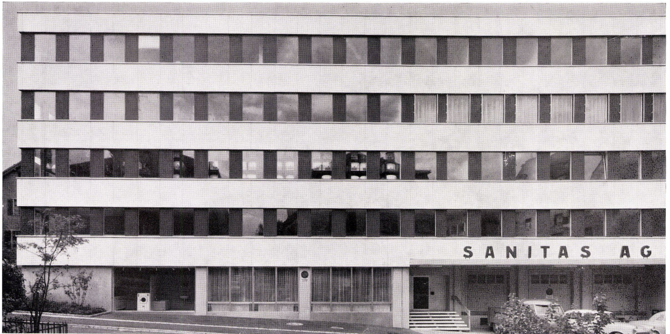
Eternitfassaden System Keller

Unsichtbare Plattenaufhängung, verdeckte Neopren-Stoßprofile, Sichtfuge 3 mm. Geschäftshaus der Sanitas AG, St.Gallen. Architekten Stäheli & Frehner