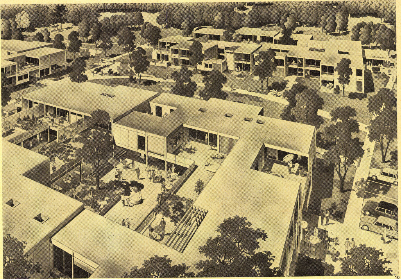
10 Isometrie einer Nachbarschaft.