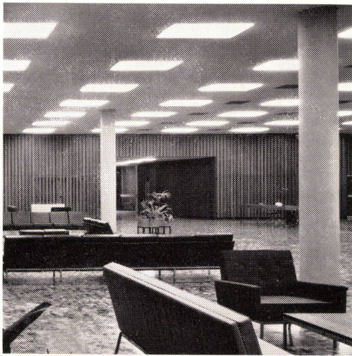
Siemens-Innenleuchten in einem Geschäftshaus

Siemens Innenleuchten für Büros, Wohnungen, Lagerhallen, Fabrikräume, Garagen usw. werden genau auf die geforderten Lichtverhältnisse abgestimmt. Unsere grosse Erfahrung garantiert Ihnen die beste Lösung aller Beleuchtungsprobleme.