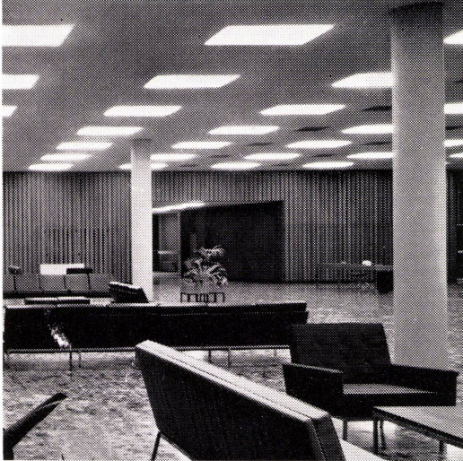
Siemens-Innenleuchten in einem Geschäftshaus

Siemens Innenleuchten für Büros, Wohnungen, Lagerhallen, Fabrikräume, Garagen usw. werden genau auf die geforderten Lichtverhältnisse abgestimmt. Unsere grosse Erfahrung garantiert Ihnen die beste Lösung aller Beleuchtungsprobleme.